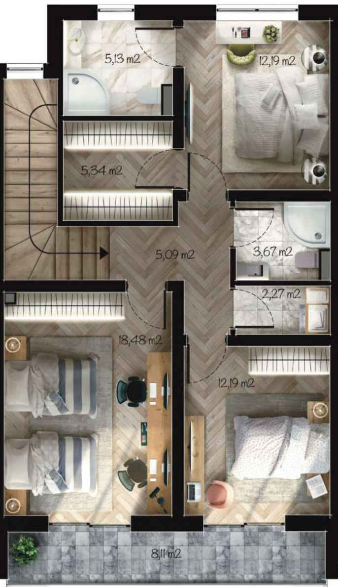
Жилище А2 Застроена площ: 94,93 m 2