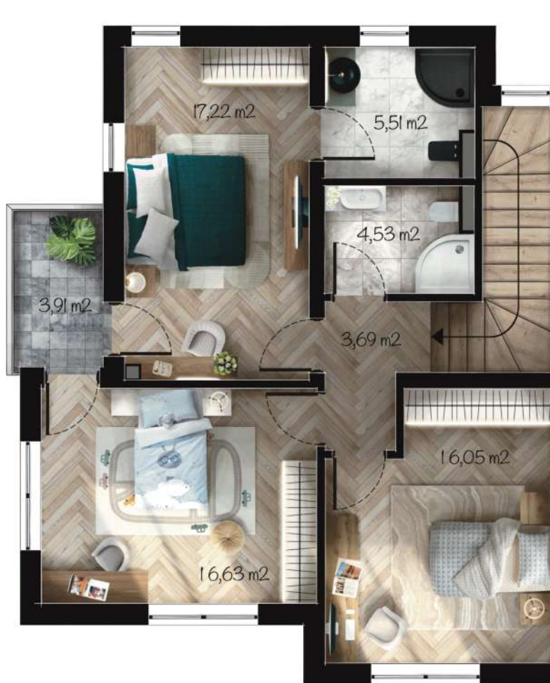
Жилище Г1 Застроена площ: 89,68 m 2