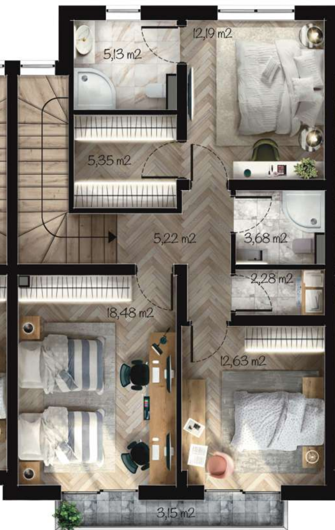
Жилище Г2 Застроена площ: 89,83 m 2