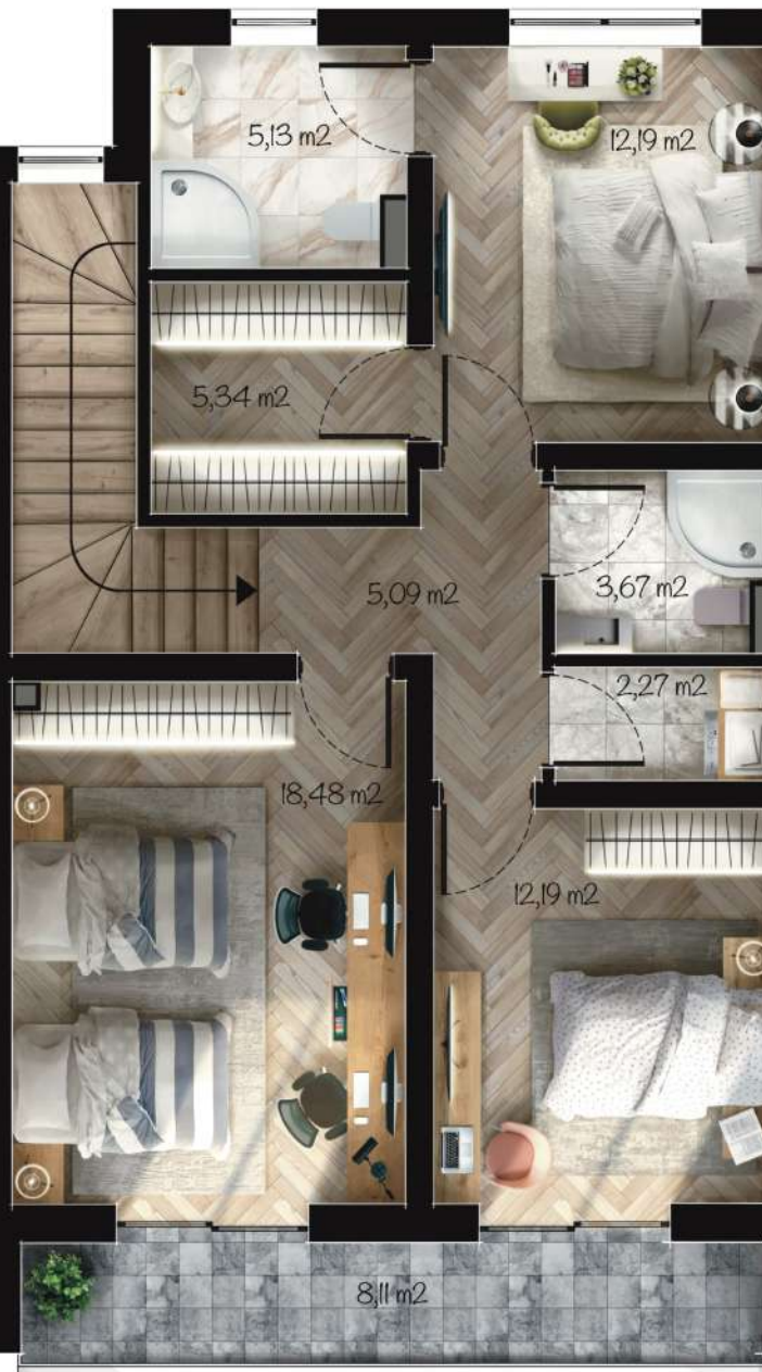
Жилище В2 Застроена площ: 94,93 m 2