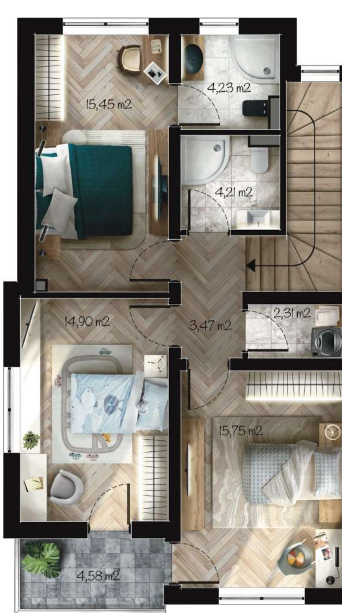
Жилище В3 Застроена площ: 87,77 m 2