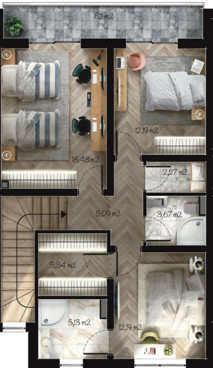
Жилище Б2 Застроена площ: 94,93 m 2