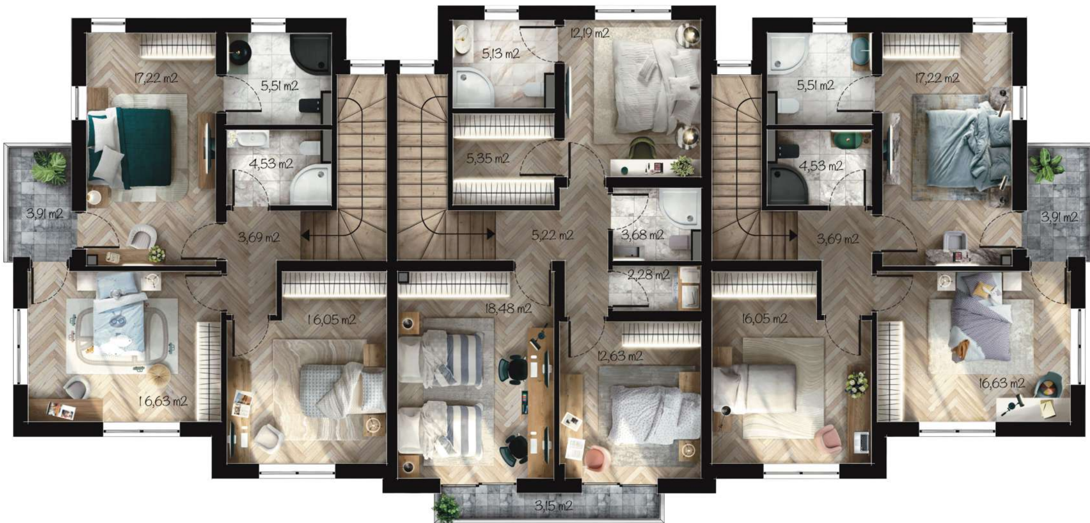
Жилище Д3 Застроена площ: 89,68 m 2