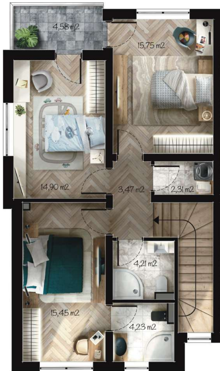
Жилище Б3 Застроена площ: 87,77 m 2